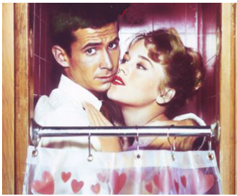
1960 LA TÊTE À L'ENVERS (Tall Story) de Joshua Logan avec Anthony Perkins