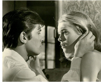
1963 LES FÉLINS (Joyhouse) de René Clément avec Alain Delon