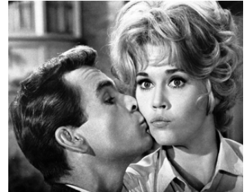
1966 CHAQUE MERCREDI (Any Wednesday) de Robert Ellis Miller avec Dean Jones