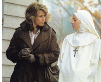
1985 AGNÈS DE DIEU (Agnes of God) de Norman Jewison avec Meg Tilly