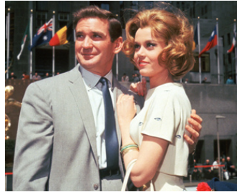
1963 UN DIMANCHE À NEW YORK (Sunday in New York) de Peter Tewksbury avec Rod Taylor