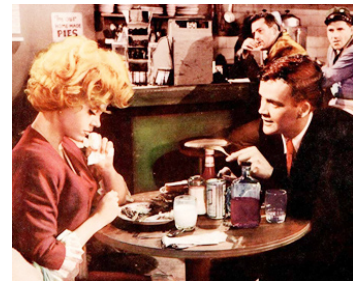
1962 L'ÉCOLE DES JEUNES MARIÉS (Period of Adjustment) de George Roy Hill avec Jim Hutton