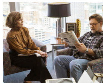
2015 PÈRE ET FILLES (Fathers and Daughters) de Gabriele Muccino avec Russell Crowe