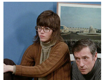
1971 TOUT VA BIEN de Jean-Luc Godard avec Yves Montand