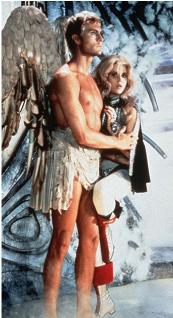
1968 BARBARELLA (Barbarella) de Roger Vadim avec John Phillip Law