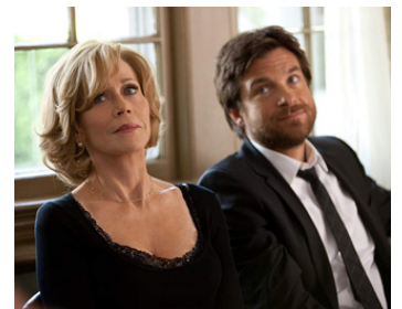
2014 C'EST ICI QUE L'ON SE QUITTE (This is where I leave you) de Shawn Levy avec Jason Bateman