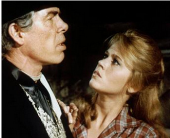
1964 CAT BALLOU (Cat Ballou) d'Elliott Silverstein avec Lee Marvin