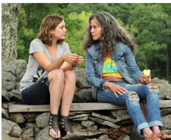
2011 PEACE, LOVE & MISUNDERSTANDING de Bruce Beresford avec Elizabeth Olsen