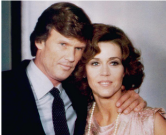
1981 UNE FEMME D'AFFAIRE (Rollover) d'Alan J. Pakula avec Kris Kristofferson