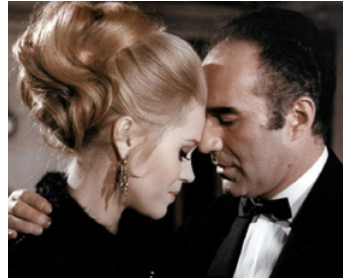
1965 LA CURÉE de Roger Vadim avec Michel Piccoli