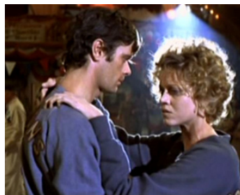
1969 ON ACHÈVE BIEN LES CHEVAUX (They shoot horses don't they?) de S. Pollack avec M. Sarrazin