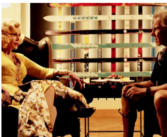
2015 YOUTH (Youth) de Paolo Sorrentino avec Harvey Keitel