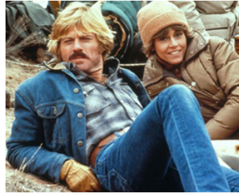
1979 LE CAVALIER ÉLECTRIQUE (The electric Horseman) de Sydney Pollack avec R. Redford