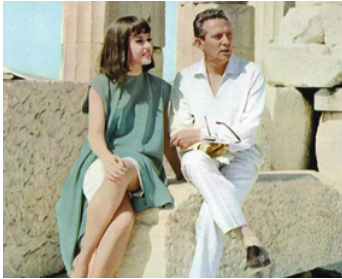
1962 LES CHEMINS DE LA VENGEANCE (In the Cool of the Day) de Robert Stevens avec Peter Finch