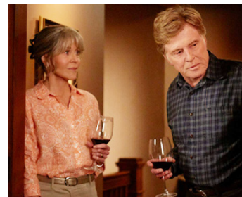
2017 NOS ÂMES LA NUIT (Our Souls at night) de Ritesh Batra avec Robert Redford