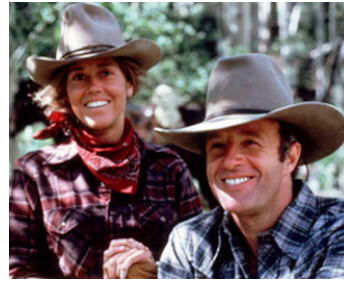
1977 LE SOUFFLE DE LA TEMPÊTE (Comes a Horseman) d'Alan J. Pakula avec James Caan