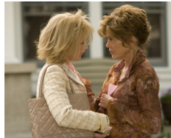
2006 MÈRE-FILLE, MODE D'EMPLOI (Georgia Rule) de Garry Marshall avec Felicity Huffman