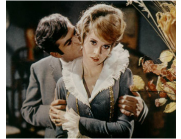
1964 LA RONDE de Roger Vadim avec Jean-Claude Brialy