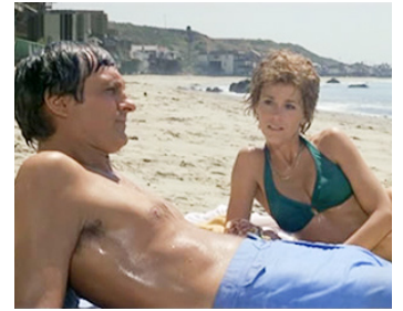
1978 CALIFORNIA HÔTEL (California Suite) d'Herbert Ross avec Alan Alda