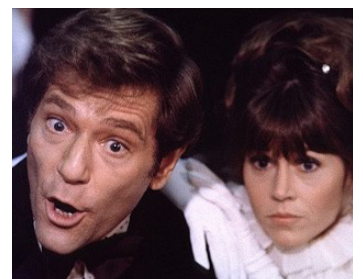
1976 TOUCHE PAS À MON GAZON (Fun with Dick and Jane) de Ted Kotcheff avec George Segal