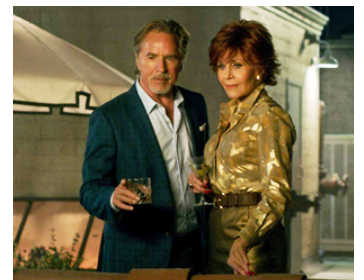
2018 LE BOOK CLUB (Book Club) de Bill Holderman avec Don Johnson