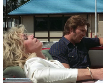
1986 LE LENDEMAIN DU CRIME (The Morning after) de Sidney Lumet avec Jeff Bridges