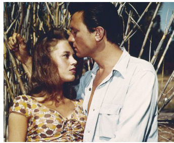
1961 LA RUE CHAUDE (Walk on the wild side) d'Edward Dmytryk avec Laurence Harvey