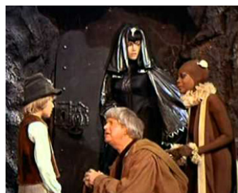
1975 L'OISEAU BLEU (The Blue Bird) de George Cukor avec Harry Andrews