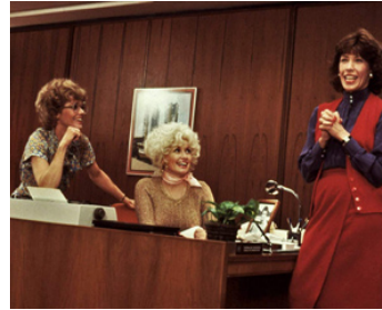
1980 COMMENT SE DÉBARRASSER DE SON PATRON (Nine to five) de C. Higgins avec D. Parton, L. Tomlin