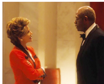
2012 LE MAJORDOME (The Butler) de Lee Daniels avec Forest Whitaker