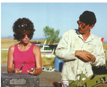
1972 LE MONDE À L'ENVERS (Steelyard Blues) d'Alan Meyerson avec Donald Sutherland