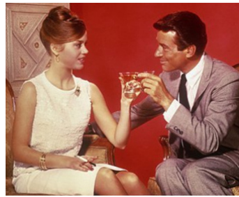
1962 LES LIAISONS COUPABLES (The Chapman Report) de George Cukor avec Efrem Zimbalist Jr