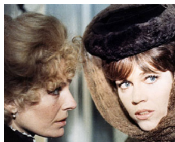
1973 MAISON DE POUPEES (A Doll's House) de Joseph Losey avec Delphine Seyrig