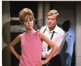
1966 PIEDS NUS DANS LE PARC (Barefoot in the Park) de Gene Saks avec Robert Redford