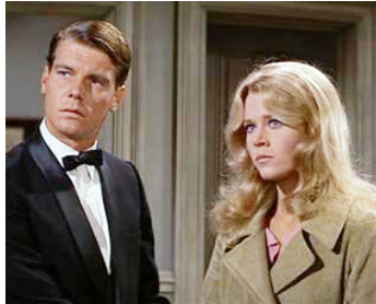
1965 LA POURSUITE IMPITOYABLE (The Chase) d'Arthur Penn avec James Fox