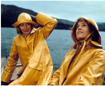
1977 JULIA (Julia) de Fred Zinnemann avec Vanessa Redgrave