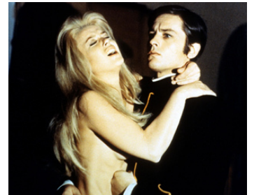
1967 HISTOIRES EXTRAORDINAIRES, partie Metzengerstein de R. Vadim avec Alain Delon