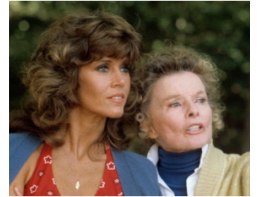
1980 LA MAISON DU LAC (On Golden Pond) de Mark Rydell avec Katharine Hepburn