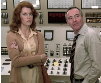
1978 LE SYNDROME CHINOIS (The China Syndrome) de James Bridges avec Jack Lemmon