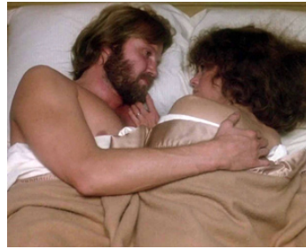
1977 RETOUR (Coming home) d'Hal Ashby avec Jon Voight